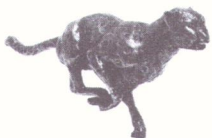
Gepard Biznesu 2011

Bank Gospodarstwa Krajowego Oddział we Wrocławiu Nr 45113010330018800155200002